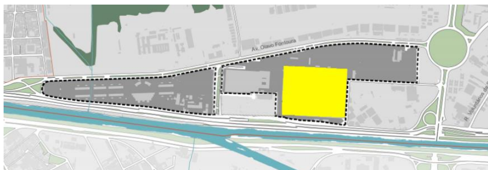
Figura 3: Localização do PAVILHÃO DE EXPOSIÇÕES