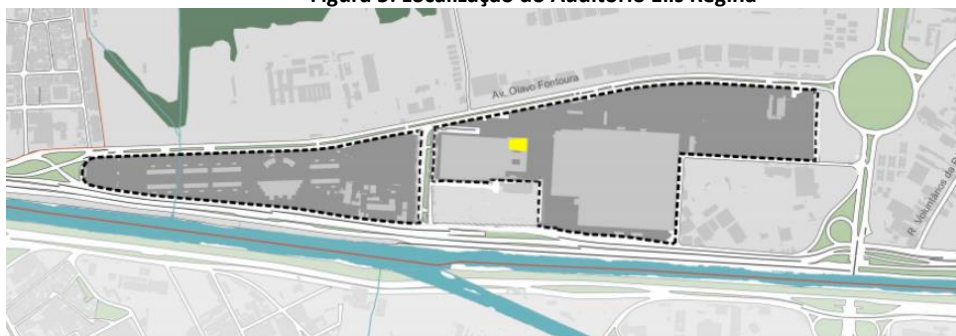
Figura 5: Localização do Auditório Elis Regina