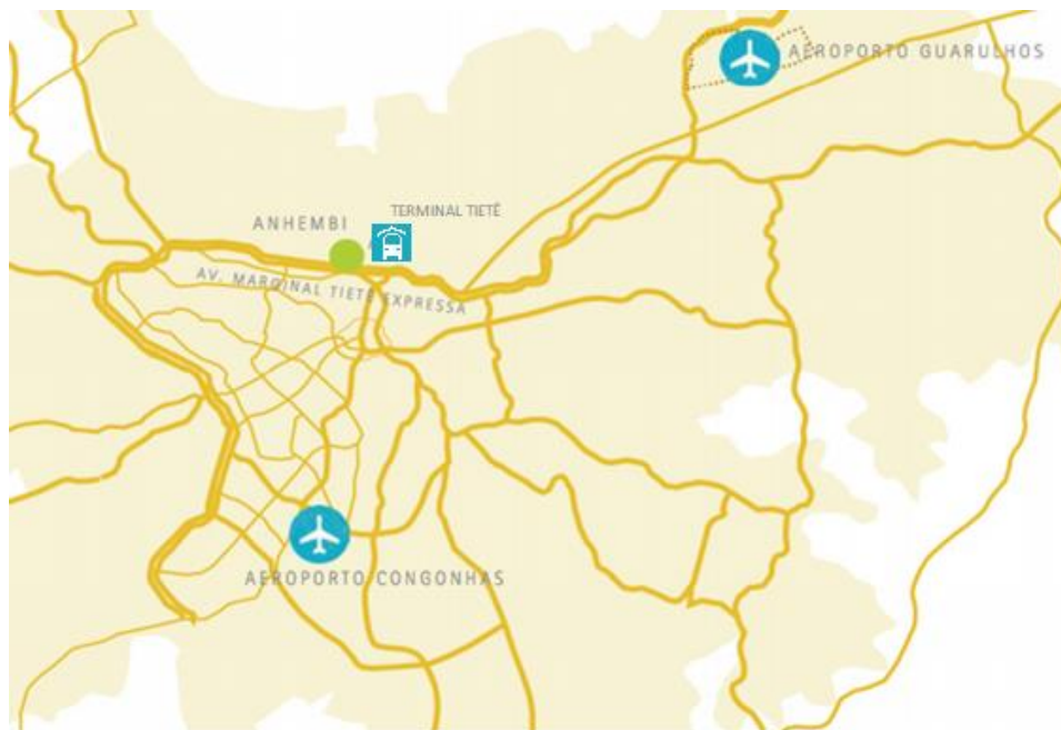
Figura 1 - Localização do Complexo Anhembi e principais acessos rodoviários do Município de São Paulo

O empreendimento possui localização estratégica, estando posicionado num raio de aproximadamente 3 km (três quilômetros) da região central da cidade, 1,5 km (um quilometro e meio) da estação de metrô Portuguesa-Tietê e do Terminal Rodoviário Tietê, às margens do corredor viário da Marginal Tietê e do aeroporto Campo de Marte e, ainda, localizado entre os Aeroportos de Guarulhos (distante 18 quilômetros) e de Congonhas (distante 13 quilômetros), de modo que sua aptidão para recepcionar eventos internacionais é consolidada no mercado.