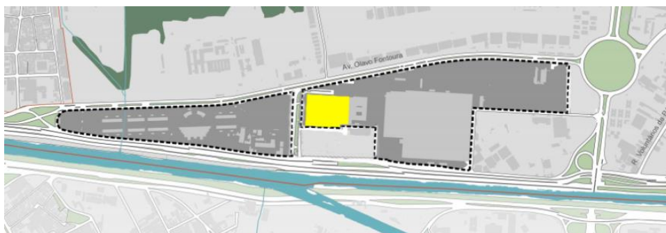
Figura 4: Localização do PALÁCIO DE CONVENÇÕES