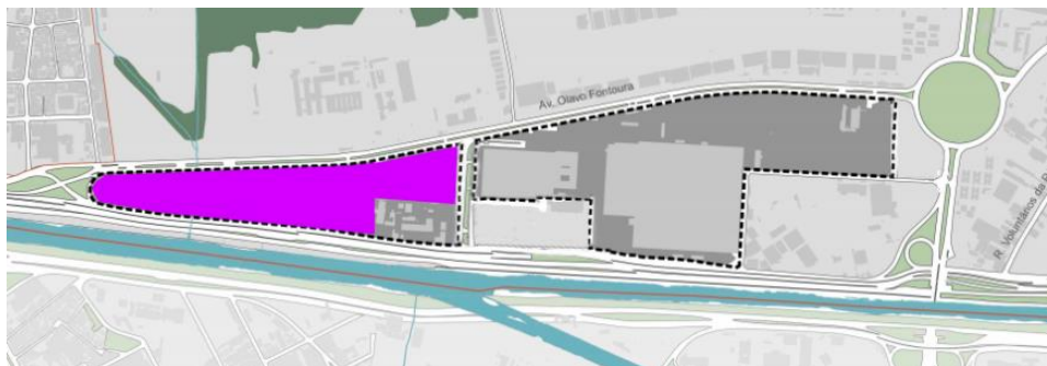
Figura 2: Localização do SAMBÓDROMO